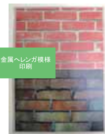
金属ヘンガ模様印刷