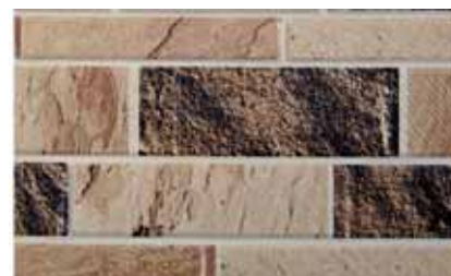
レンガ模様のサンプル印刷イメージ サイディング材、ヘンガ模様を印刷しました。 オンデマンドでデータをリアルタイムに印刷します。