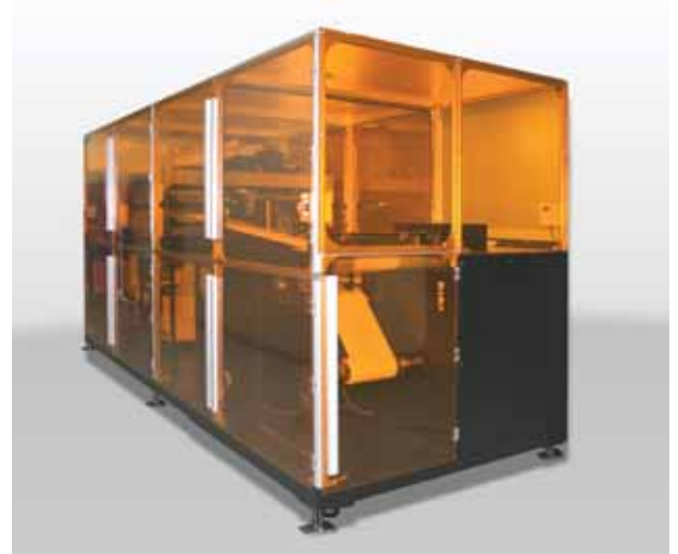
※画像はイメージです。実際のものとは異なる場合がございます。

京セラ製・KMIJ製・東芝テック製ヘッドに対応 Xaar1001・Dimatixヘッド追加対応予定